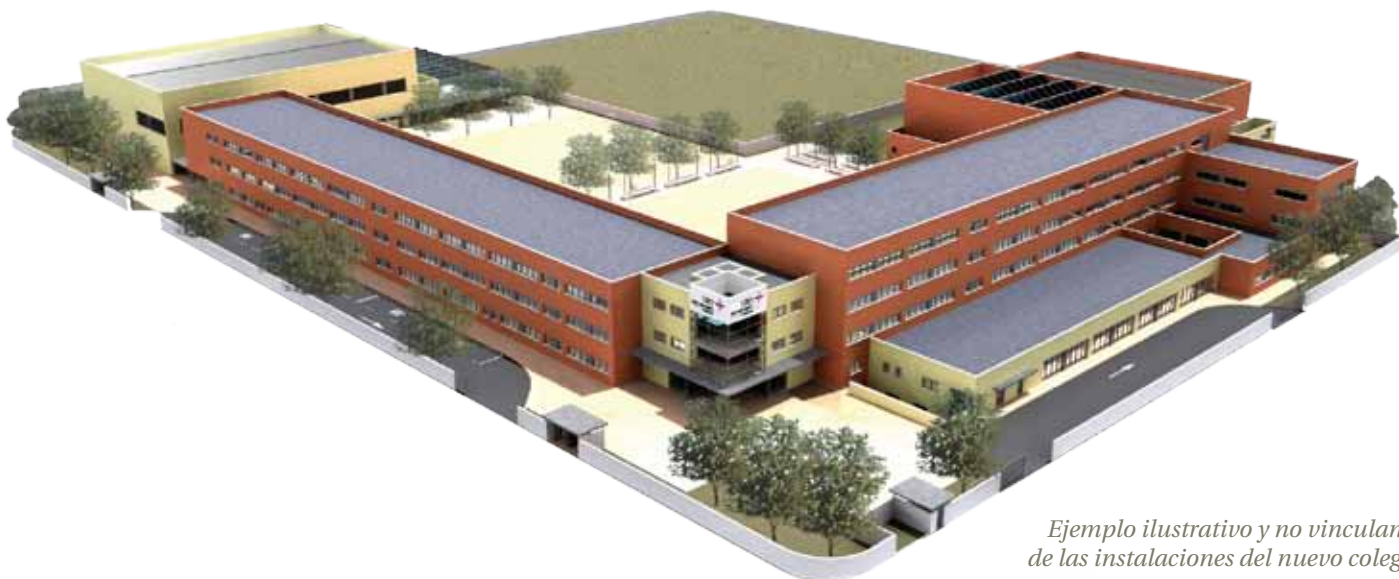
Ejemplo ilustrativo y no vinculante de las instalaciones del nuevo colegio